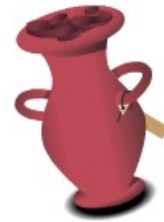
z płatnym podbiciem

Aukcja tradycyjna (klasyczna) - rodzaj aukcji przeprowadzanej za pośrednictwem Internetu. Punktem wyjścia jest zwykle cena wywoławcza, od której zaczyna się licytacja, czyli zgłaszanie przez potencjalnych nabywców coraz wyższej ceny za oferowany towar. Zakupu dokonuje podmiot, który w ramach licytacji zaproponuje najwyższą cenę.